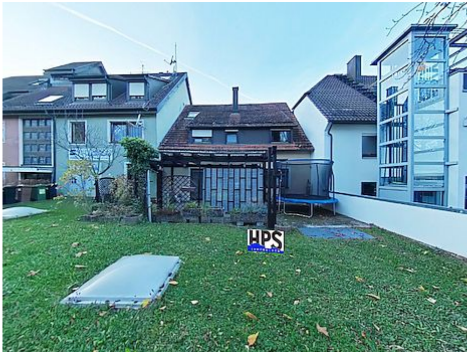
Rückseite mit Garten